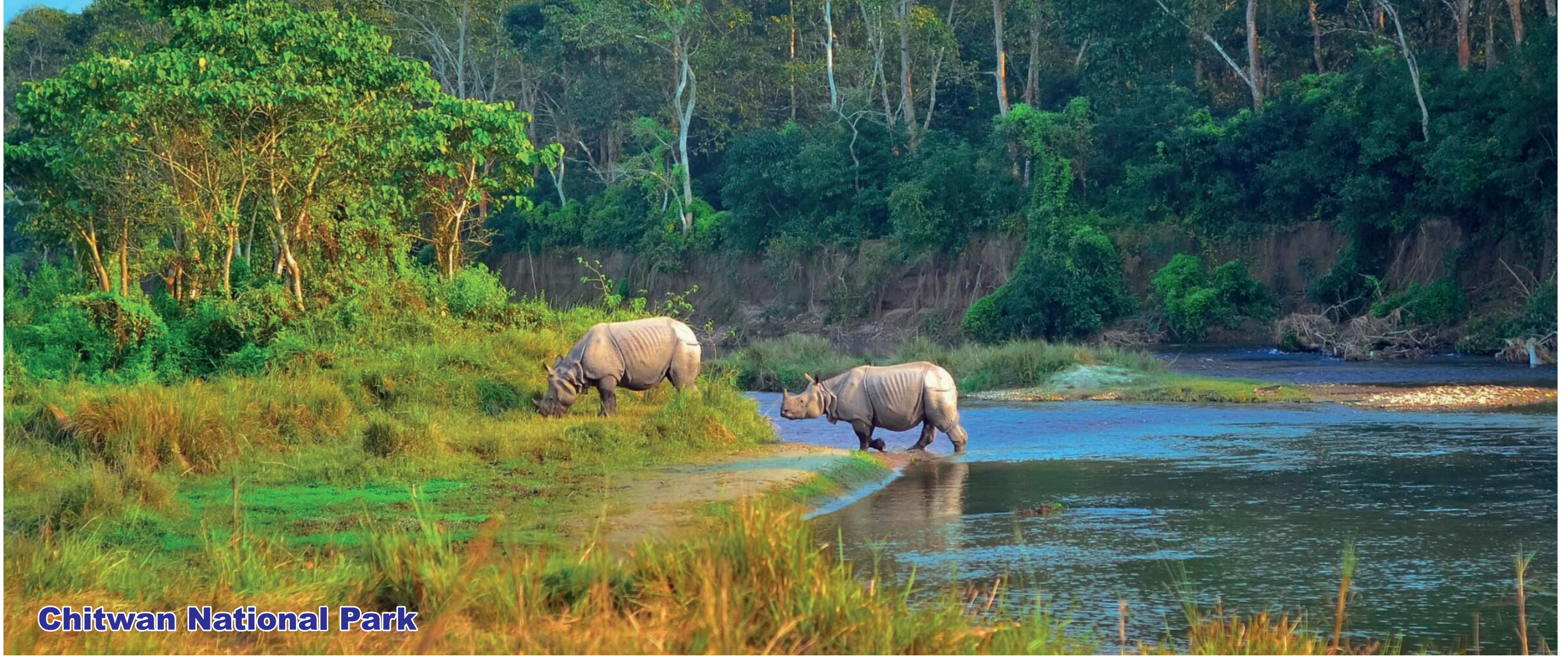
Chitwan National Park

Maijubahal, Chabahil, Kathmandu Tel.: 01-4562223, 4585087, 4493801 Email: info@riviera.edu.np Website: www.riviera.edu.np