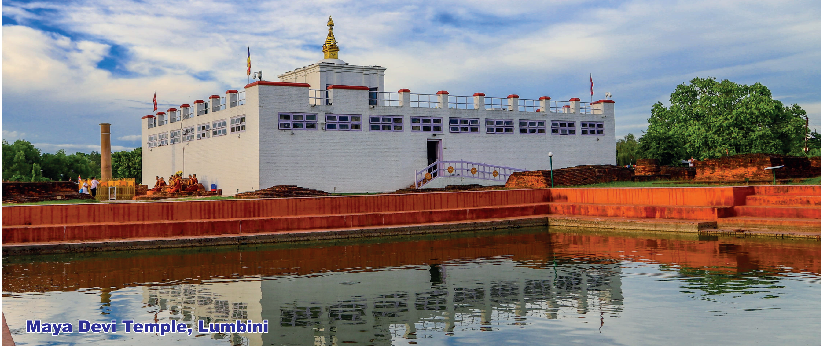
Maya Devi Temple, Lumbini

Maijubahal, Chabahil, Kathmandu Tel.: 01-4562223, 4585087, 4493801 Email: info@riviera.edu.np Website: www.riviera.edu.np