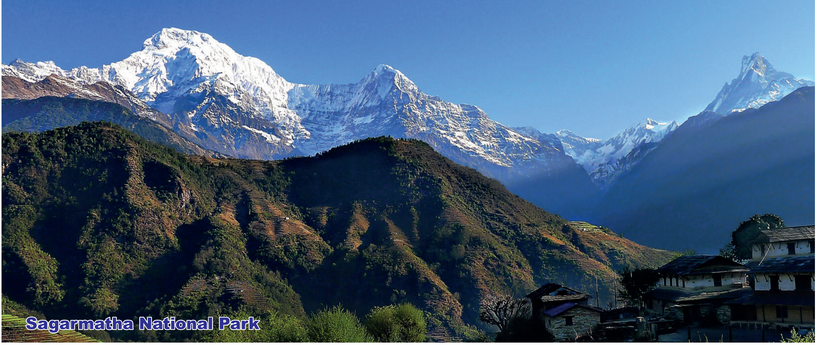
Sagarmatha National Park

Maijubahal, Chabahil, Kathmandu Tel.: 01-4562223, 4585087, 4493801 Email: info@riviera.edu.np Website: www.riviera.edu.np